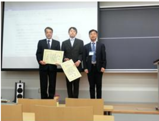
技術賞表彰の様子