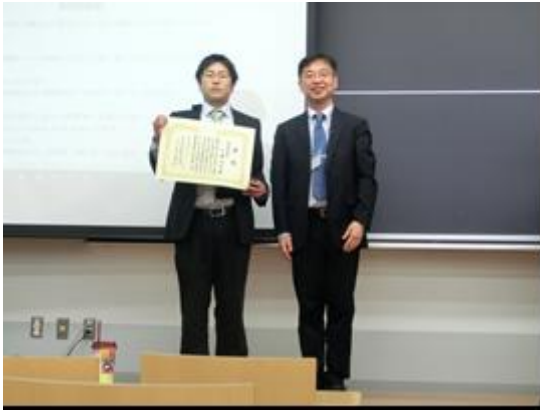
研究奨励賞表彰の様子