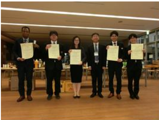
若手優秀講演賞表彰の様子