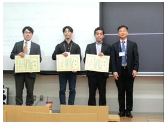
論文賞表彰の様子