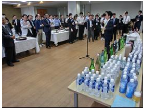
懇親会会場の様子