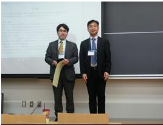
学会賞表彰の様子