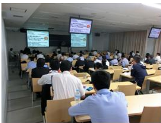
講演会会場の様子