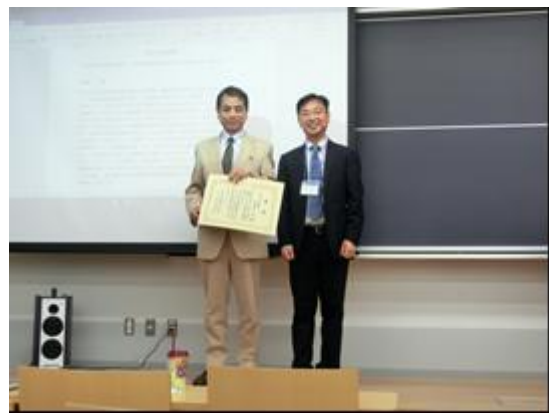
地下水学術賞の様子