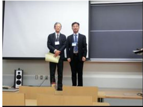
名誉会員表彰の様子