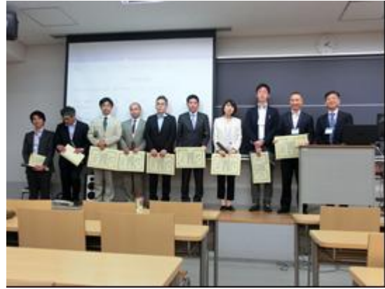
学会功労賞表彰の様子