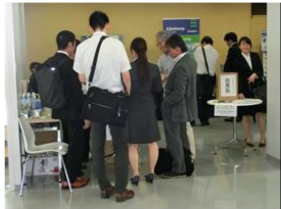
地下水学会が選ぶ名水コーナーの様子