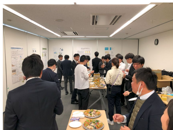
写真 2. 後半の自由交流の様子